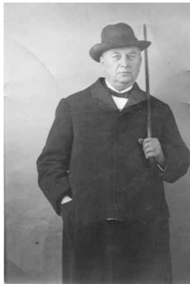
huisarts dokter Siemens

Ruim tien jaar later volgde een verordening over het begraven van gestorven en afgemaakt vee en een politiereglement over de reiniging van goten, privaten (toiletten) en woningen.