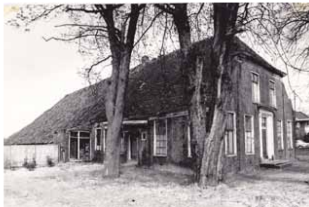
Boerderij “Remkes”, omstreeks 1994

De aan de Noorderstraat, precies tegenover het Borgercompagniesterdiep, staande Veenkoloniale boerderij van de familie Remkes vertoonde reeds jarenlang een sterke mate van verval. Na een brand in het woon- en schuurgedeelte in 1998 werd het pand in hetzelfde jaar nog gesloopt. Op de plek van de boerderij is naderhand het haventje van het ontwikkelingsplan “Ijsbaanlocatie” aangelegd.