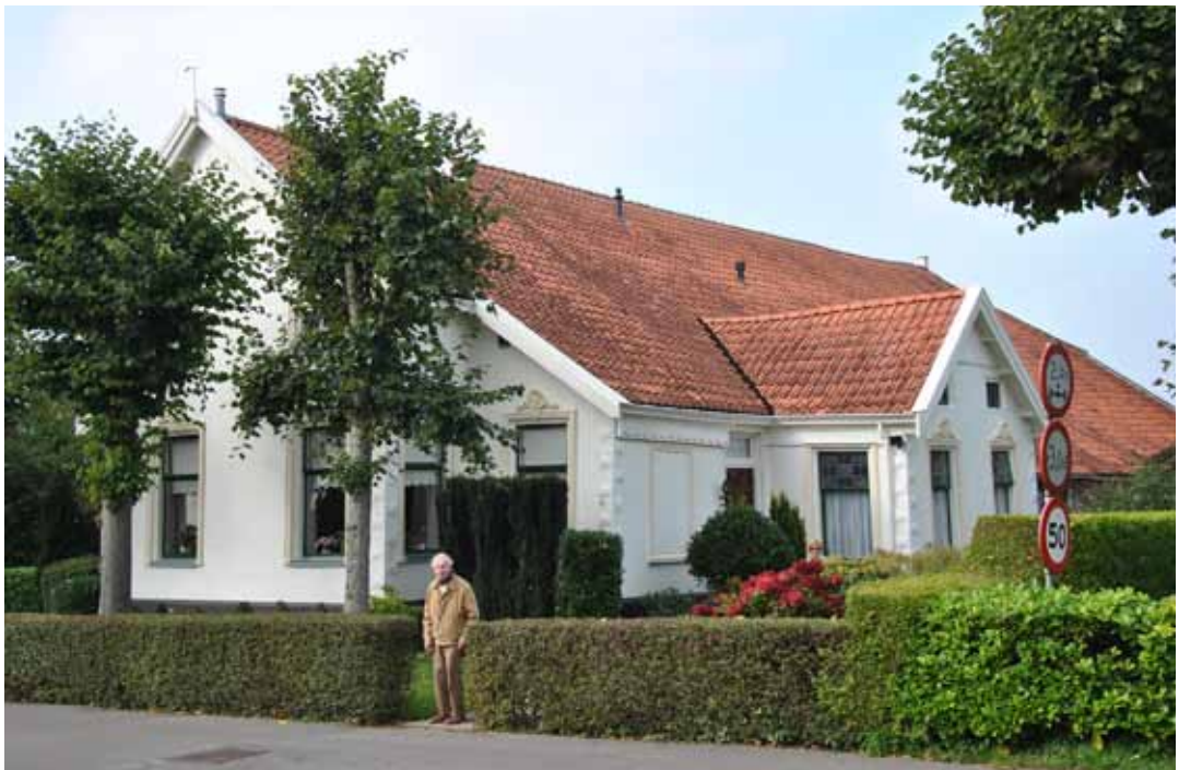
van Dam voor zijn boerderij aan het Achterdiep