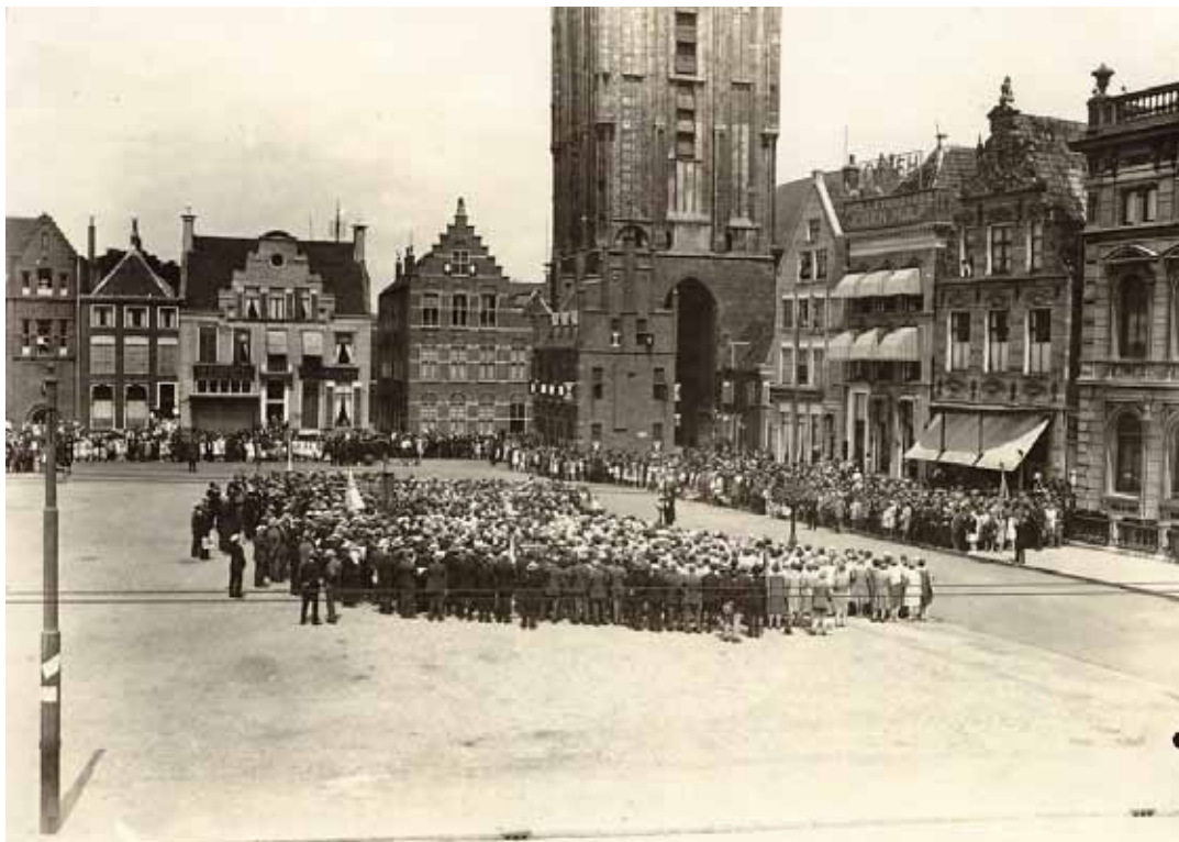
Parade op de Grote Markt met geheel rechts een gedeelte van het Scholten-huis

len, diepe grachten langs de Groningerweg. Ook voor ons huis kuilen, waarin je kunt gaan als er vliegers (spitfires) in de buurt zijn. Ze schieten op alles wat langs de weg rijdt, ook paard en wagens en de boten in het Winschoterdiep. Het nieuwe bestuur met Anton Mussert de leider (lijder) van de NSB en Rost van Tonningen, de nieuwe minister van Financiën en de grote leider Seyss Inquart, een Oostenrijkse nazi (hij loopt mank en wordt daarom ook wel “Zes en een Kwart” genoemd).