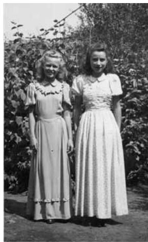
tweede klas HBS in baljurk naar feest