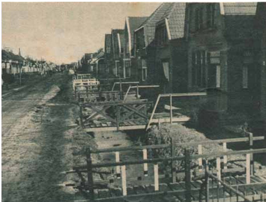
De bewoners van de Slochterstraat te Sappemeer hadden verzocht de sloot te dempen en daardoor de waterleidingbuizen te leggen. De buizen zullen echter door de voortuintjes gelegd worden. Febr. 1933

centrale drinkwatervoorziening en Gedeputeerde Staten stelden plannen op. Hoogezand bleek in principe bereid om mee te doen, maar de Eerste Wereldoorlog leidde ook in dit geval tot vertraging. Omstreeks 1921 kwamen nieuwe plannen op tafel.(5) Ditmaal speelde de Gezondheidscommissie een stimulerende rol. Volgens deze plannen zou de provincie zorgen voor pompstations, de bouw van watertorens en voor de aanleg van het net. De betrokken gemeenten zouden de tarieven vaststellen, de aansluitingen verzorgen en de watergelden innen. Ook moesten de gemeenten garant staan voor een voldoende aantal aansluitingen, anders zou het financieel niet uit kunnen. B&W van Hoogezand zag wel in dat een goede drinkwatervoorziening van belang was voor de volksgezondheid, maar was bang voor de financiële gevolgen. Omdat het plan verstrekkende gevolgen had voor de gemeentefinanciën, stelde het de gemeenteraad voor om het voorstel eerst van alle kanten te bezien en nog niet direct een beslissing te nemen. De raad nam dit advies ter harte en wilde eerst onderzoeken of er wel genoeg ingezetenen belangstelling hadden voor een aansluiting. Het probleem was dat er nog nooit betaald was voor drinkwater. Aan de andere kant waren er mensen die in normale tijden al onvoldoende regenwater hadden en dat er bij langdurige droogte een groot tekort aan regenwater was. Het putwater was eigenlijk ongeschikt als drinkwater. De bevolking, en vooral de bevolking in de buitengebieden, bleek echter