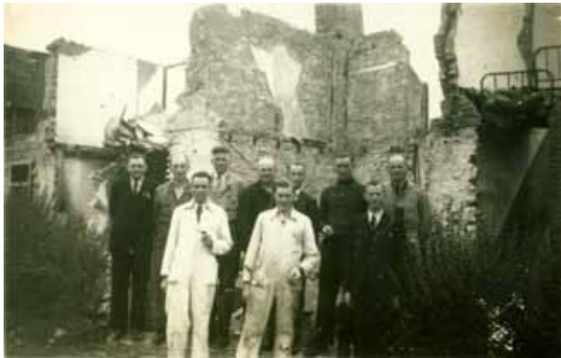
Aannemers, timmerlieden en loodgieters van de hulpactie uit Hoogezand en omgeving op de Middenlaan in Heveadorp. Ondanks de namenlijst van wederopbouwwerkers in bijgaande leestekst is niet bekend wie nou wie is. Informatie hierover is welkom.