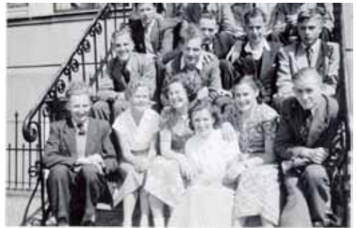
HBS klas 5A en B gedeeltelijk