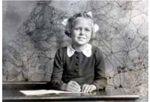
december 1942, lagere school 9 jaar

In de schoenendoos liggen klassenfoto's uit de lagere school, de Komschool: eerste, tweede en derde klas. Van de vierde klas geen klassenfoto, wel de bekende “leerling in de bank in schrijfhouding”.