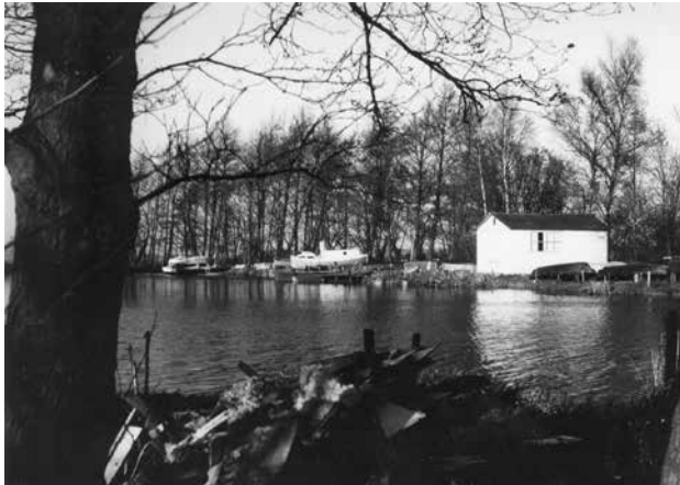
Batshaven (1950)

zo voorbij met het bedienen van de watermolen en het botenverhuurbedrijf, maar toen zagen ook de andere boeren in de omgeving van het Zuidlaardermeer, dat er brood met het verhuren van boten te verdienen was. H. van der Schuur was de volgende die een haven liet uitgraven aan de rand van het Zuidlaardermeer, in de buurt waar ook grootvader zijn haven had! Er is toen een rechtszitting geweest over de aanleg van de nieuwe haven van de heer van der Schuur. Grootvader heeft dat toen verloren, maar hij heeft het er niet bij laten zitten. Hij is in 1930 begonnen het uitgraven van een nieuwe haven. Met frisse moed en energie is hij daar mee gestart gesteund door zijn vrouw, kinderen, familie en goede vrienden! In april 1968 is de molenaarswoning afgebroken i.v.m. het aanleggen van het recreatie gebied Meerwijck. Vanaf deze tijd had mijn oom het botenverhuurbedrijf, de visserij en de veehouderij gescheiden. In 1971 is mijn oom overleden en is daarmee het botenverhuurbedrijf, de visserij en de veehouderij gestopt bij de Batshaven.