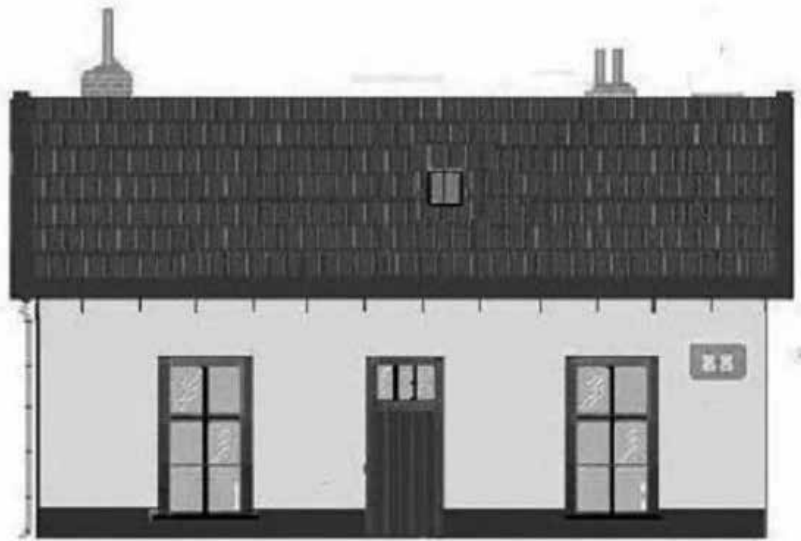
Wachtpost 88