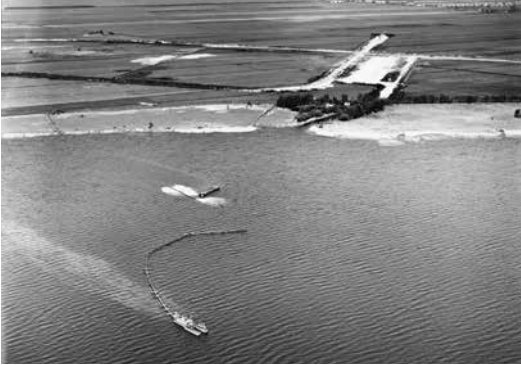
Overzicht Zuidlaardermeer 1969

Om een goed beeld te krijgen van de zeilerij in die dagen is het noodzakelijk dat enig inzicht wordt verschaft in de ecologische situatie op en rondom het Zuidlaardermeer. Omstreeks 1900 bood het Zuidlaardermeer een kale, in onze ogen ook wel een troosteloze indruk. Het wateroppervlak was veel groter dan nu het geval is. Het water liep tot aan de zgn. klufken hogegeand ruggen op de uiteinden waarvan destijds de camping “de Rietzoom” is gevestigd. Verder waren in deze periode de polders nog zeer gebrekkig bedijkt. 's Winters stonden deze polders dan ook herhaaldelijk onder water. In het begin van de twintiger jaren is het polderbeheer in deze regio gemoderniseerd door de plaatsing van windmolens.