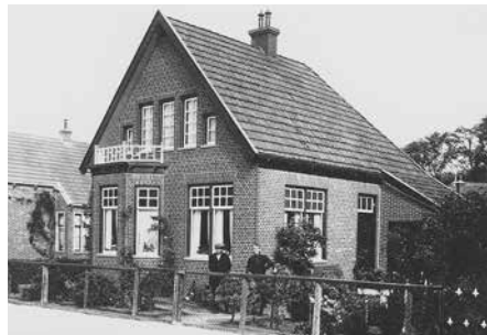
Ouders van Evert

Vanaf 1921 bevindt Evert zich waarschijnlijk weer aan boord van het schip van zijn ouders, nog steeds met als adres Foxhol P162a. In het bevolkingsregister wordt als zijn beroep binnenschipper vermeld.