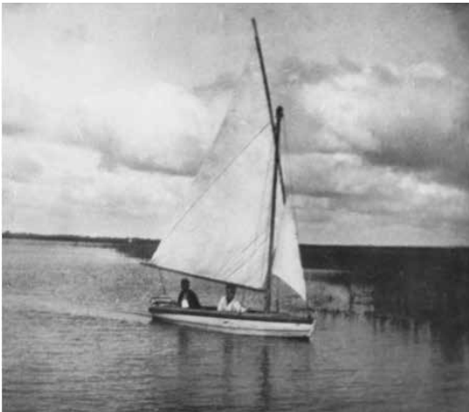
Zeilers op het Zuidlaardermeer