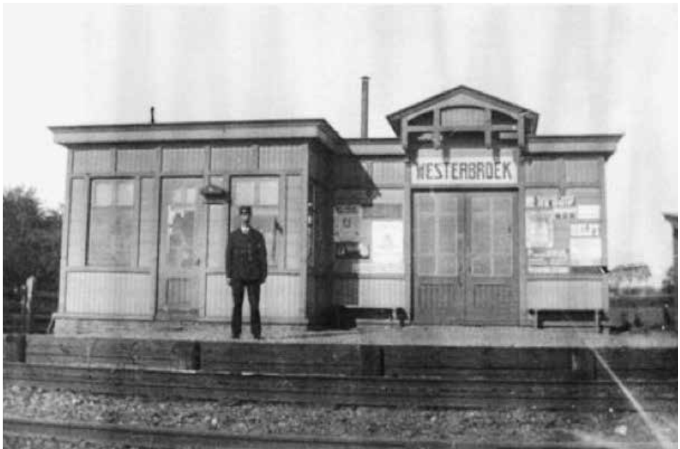
Op de foto de halte met de stationschef

Aan het einde van de Ernergieweg richting Westerbroek ziet men een vrij woest gebied. Hier stond aan de noordkant van de spoorlijn die in 1868 geopend is de halte van Westerbroek. Even meer de kant op van Groningen stond de spoorwoning van de halte chef Smits en een wachterswoning. De wachterswoning was van het standaard type. Een dergelijke woning staat tegenwoordig ook nog in Waterhuizen. De halte Westerbroek is waarschijnlijk per spoor aangekomen en in delen in elkaar gezet. De eenvoudige halte met wachtruimte is in 1914 geopend. Dit was net na de periode dat het traject dubbelsporig werd. De halte had ook een telegraafverbinding. Het heeft ook veel weg van de oude halte van Martenshoek.