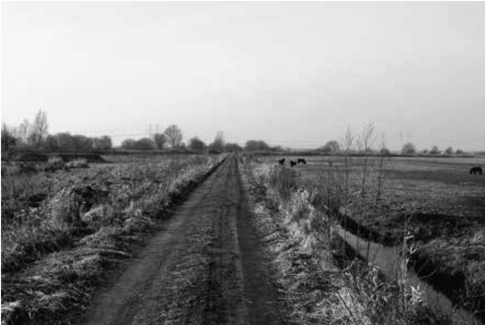
De oude stationsweg naar het spoor

De halte heeft het waarschijnlijk nooit erg druk gehad want in het jaar 1930 werd hij al weer opgeheven. De halte werd gedemonteerd en werd in Klein Ulsda weer opgebouwd. In de jaren zestig werden aan de noordkant van de oude halte plaats sporen gelegd die naar de glasvezel-fabriek van Silenka liepen. Aan de oostkant ging het spoor zelfs nog verder dan de fabriek. Ook liep er een spoor aan de westkant om de fabriek heen naar het Winschoterdiep. De spoordijk is hier nog te herkennen. Vlak voor het Drentsediep kwam het industrie spoor weer op het traject van Nieuweschans naar Groningen. De spoorbrug werd ook vaak door fietsers en wandelaars gebruikt als sluiproute. Bij de spoorbrug lagen in die tijd veel baggerboten en een woonboot. Van de halte plaats is niks meer te herkennen. Een van de laatste overblijfselen is de oude Stationsweg, zie foto hieronder.