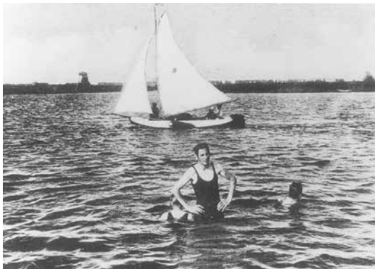
Watersport op het Zuidlaardermeer