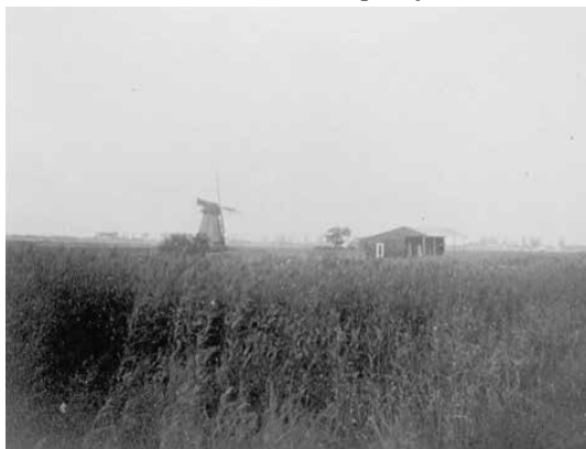
Botenhuis en de watermolen (1929)