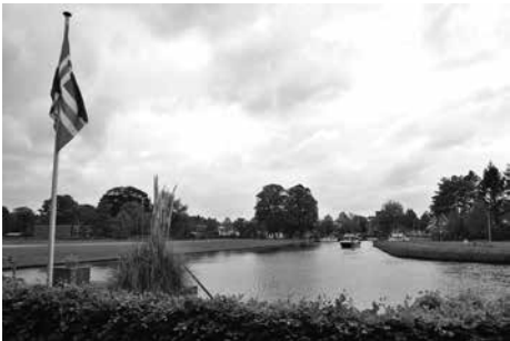
Uitzicht vanuit mijn woning te Sappemeer

En allemaal blijde mensen, blij met het boek en blij met mijn bezoek! Over deze ervaringen kan ik wel weer een volgend boek schrijven. Ik laat het hier eerst bij, wie weet tot een volgende keer!