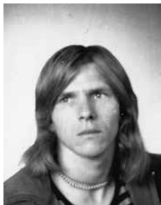
Cor anno 1967

26 augustus 1965 was het begin van mijn werkzame periode bij scheepswerf E.J.Smit & zoon. Hierbij een verslag hoe ik bij deze unieke werf aan het werk kwam en waar ik tot het einde van het bedrijf in dienst ben gebleven.