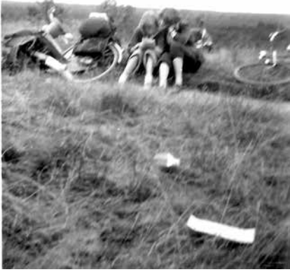
Ineke en Jikke

oorlogskerkhof al eens hebben gezien. Na een moeizame beklimming mogen er nog maar een paar meisjes op. Tot 15 jaar met short en verder alleen met rokken. Natuurlijk heeft niemand dat. We kopen in Wageningen brood en boter, dan gaan we over fietspaden verder om een eind af te snijden en vlak langs een woonwagenkamp, waar we niet erg netjes betiteld worden, want we kunnen de weg niet vinden en er moet een kompas bij te pas komen. We gaan verder over een bijna onberijdbaar fietspad en we blijven op ongeveer 3 meter voor Ginkel steken vlak bij een spoorwegovergang waar bijna elke 10 minuten een trein langs gaat. We eten en rusten. Het is hier schitterend, een stuk hei tussen bomen in. We fietsen het fietspad uit en dan gaan we over een drukke verkeersweg midden door het Planken wambuis. Om er sneller te komen gaan we over een verboden fietspad en we komen zo in Oudreemst en over de Hoge Veluwe fietsen we verder. Zo mooi als hier hebben we nergens nog gezien, eerst komen we door een gebied van zandverstuivingen en heide en dan komen we in het aangeplante gedeelte. We rusten even uit en