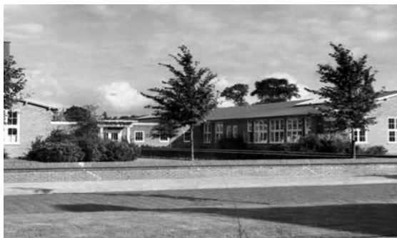
Technische school Hoogezand